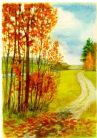
И. Левитан "В лесу осенью"