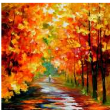
В. Куприянов "Осень"