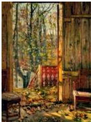
Ф. Васильев «Перед дождем»